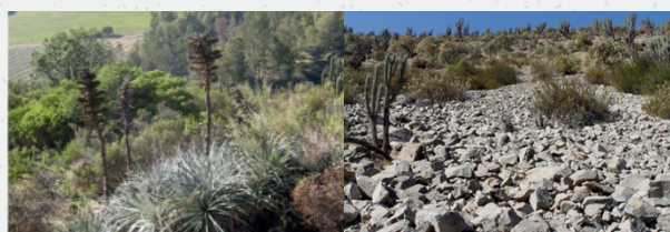
Laderas con chaguales

Identificar los lugares donde podrían encontrarse: